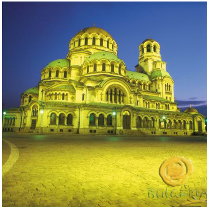
Cathédrale Alexander Nevski

« En Bulgarie, il n'y aura pas d'autre parti au pouvoir que nous », déclarait Todor Jivkov au journal « Le Monde » en janvier 1989. Le secrétaire général du Parti communiste bulgare, au pouvoir depuis 1954, ne se doutait pas que ses propos seraient démentis moins d'un an après.