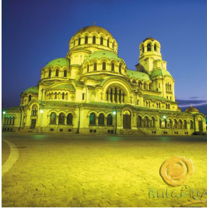
Cathédrale Alexander Nevski