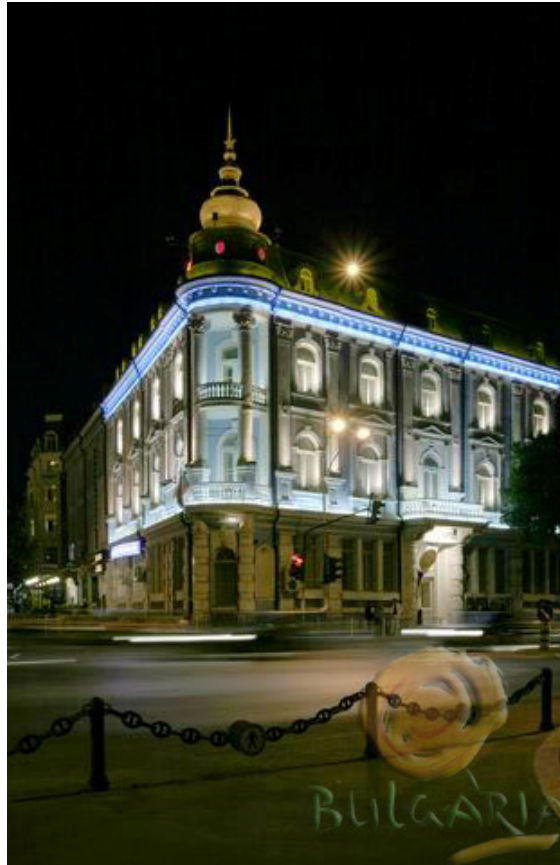
Ville de Varna